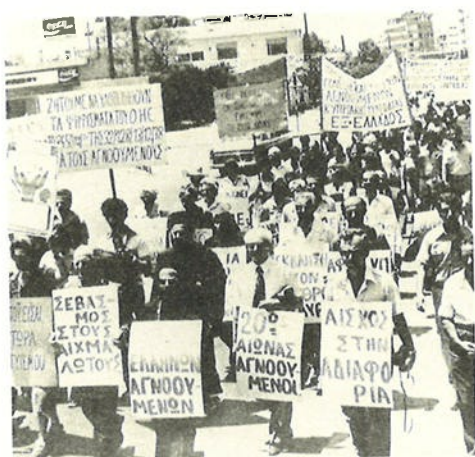
ΑΠΟ ΤΙΣ ΠΡΩΤΕΣ ΚΙΝΗΤΟΠΟΗΣΕΙΣ ΤΩΝ ΣΥΓΓΕΝΩΝ ΤΩΝ ΑΓΝΟΥΜΕΝΩΝ ΤΟ 1974.

Ο Μακάριος κάλεσε σε σύσκεψη την Επιτροπή Συγγενών και στην παρουσία του διαπραγματευτή Γλαύκου Κληρίδη έδωσε διαβεβαιώσεις ότι το πρόβλημα των αγνοουμένων θα ετίθετο στις συνομιλίες και ότι θα επιδιωκόταν η δημιουργία ερευνητικής επιτροπής, υπό την αιγίδα των Ηνωμένων Εθνών. Η κυβέρνηση τήρησε την υπό-